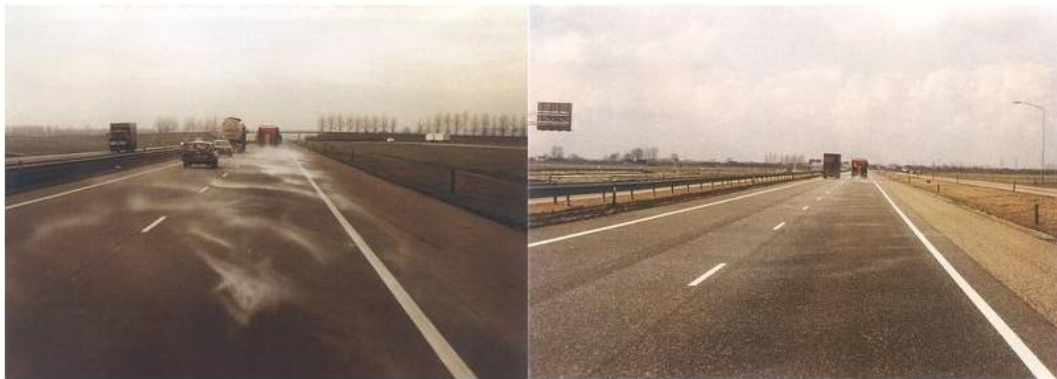
Links: verwaaiing bij droogzout strooien. Rechts: strooibeeld natzoutstrooien.

Een aangereden sneeuw- of ijsmassa is moeilijk te bestrijden. Het vasthechten van sneeuw- en ijs aan het wegdek kan worden voorkomen door preventief te strooien. Hierdoor ontstaat er een soort anti kleeftlaag, waardoor de sneeuw of ijzel niet aan het oppervlak kan hechten en gemakkelijker en dus sneller te verwijderen is en met minder wegezout.