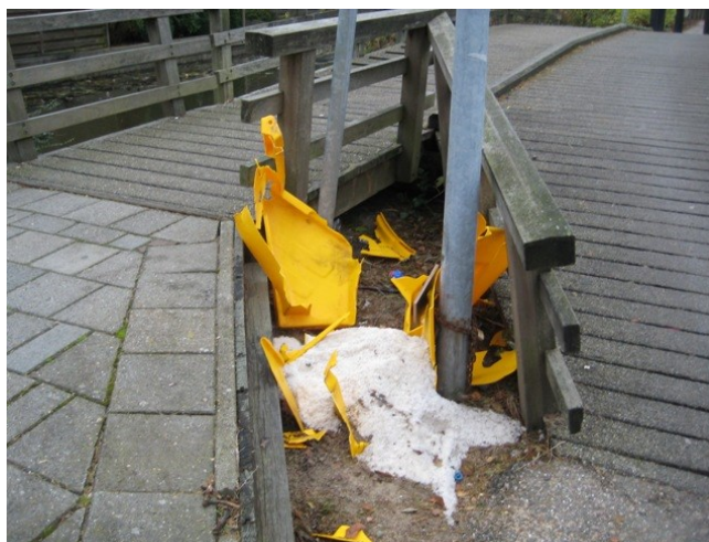
Vernielingen van zoutbakken is een jaarlijks terugkerend probleem.