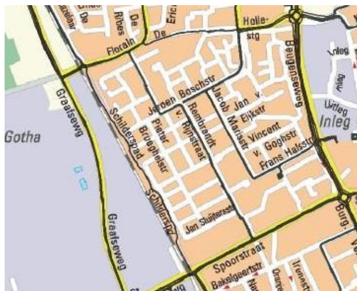
Voorbeeld van plattegrond gedeelte 1 ste strooiroute

Bij extreem weer, waarbij blijkt dat het 1 ste strooisceario niet binnen de gestelde tijd uitgevoerd kan worden, zal gekozen worden om als eerste de gebiedsontsluitingswegen binnen de gestelde termijn te strooien. Hierna zullen dan de opgenomen erftoegangswegen in de 1 ste strooisceario meegenomen worden.